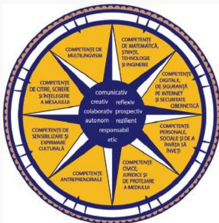
Figura 1. Dimensiuni principale care contribuie la definirea profilului de formare al absolventului

Profilul de formare al absolventului funcționează ca o busolă pentru întregul sistem educațional, în care elementele continuumului predare-învățare-evaluare conlucrează pentru realizarea idealului educațional definit în lege.