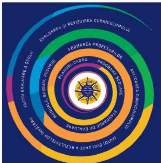
Figura 2. Continuumul predare-învățare-evaluare

În acest sens, profilul de formare al absolventului funcționează ca nucleu ce fundamentează, influențează și orientează constructul curricular, din perspectiva imediată a documentelor reglatoare, planuri-cadru de învățământ și programe școlare, precum și din perspectiva aplicării curriculumului: